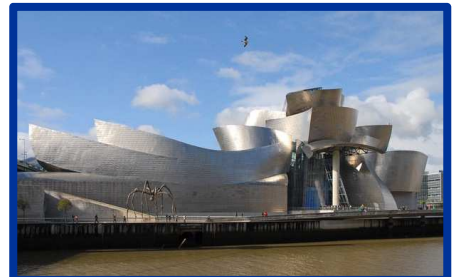
Musée Guggenheim de Bilbao, Frank Gehry, 1997.

ADMAGAZINE, « 12 bâtiments iconiques qui défient les lois de la pesanteur », 06/04/2020. https://www.admagazine.fr/architecture/diaporama/12-batiments-deconstructivistes-iconiques/59783