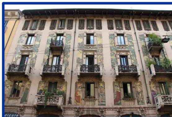
La casa Galimberti, Milan.