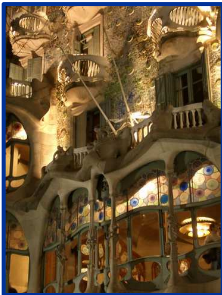
Casa Batlló, Antoni Gaudí, Barcelone (1877).