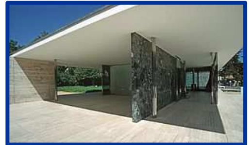
Le Pavillon allemand de Barcelone, Mies van der Rohe, conçu pour l'exposition universelle de Barcelone en 1929, et reconstruit dans les années 80.

Le 14 octobre 2020, dans le cadre du 'Green New Deal' européen, Ursula von der Leyen, présidente de la Commission européenne, s'est prononcée pour la création d'un « nouveau Bauhaus européen ».