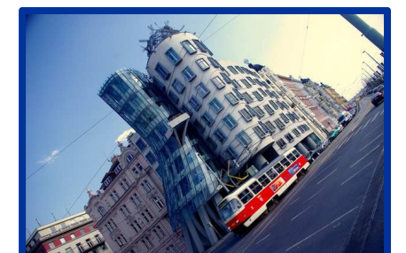
La maison qui danse (Tančící dům), Prague, Vlado Milunić et Frank O. Gehry, 1996.