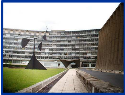
Maison de l'UNESCO, Paris, Marcel Breuer, 1953.