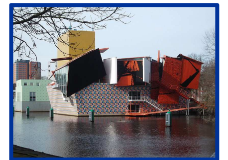
Groninger Museum, Pays-Bas.