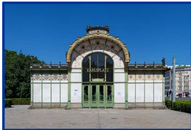
Pavillon Otto Wagner. Vienne.