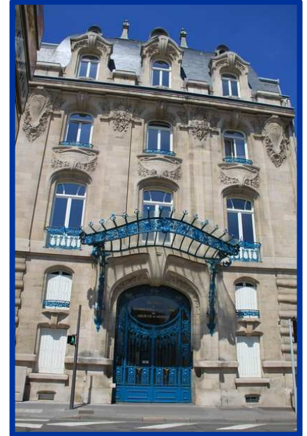
Chambre de Commerce et d'Industrie de Nancy, 1906-1908.

https://www.lemonde.fr/voyage/article/2006/11/17/en-europe-les-villes-art-nouveau-sont-en-reseau_835719_3546.html